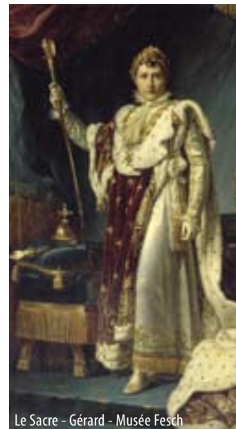
Le Sacre - Gérard - Musée Fesch