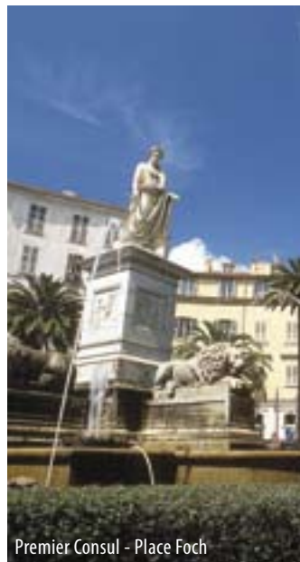
Premier Consul - Place Foch

Napoleone I non è l'unico imperatore onorato nella città. Il suo successore, Napoleone III, è ricordato per la sua grande benevolenza verso l'isola.