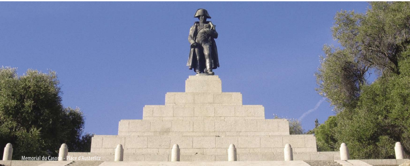
Memorial du Casone - Place d'Austerlitz

Le souvenir de Napoléon Bonaparte plane sur la ville et nombreux sont les lieux, les rues, les édifices qui rappellent qu'en cette année 1769 naquit le futur Empereur.