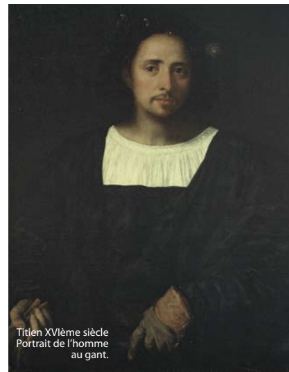
Titien XVIème siècle Portrait de l'homme au gant.

Tarifs : plein tarif 5,35 € Groupe (10 pers. et +) et tarifs réduits : 3,80 €