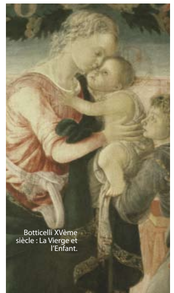
Botticelli XVème siècle : La Vierge et l'Enfant.