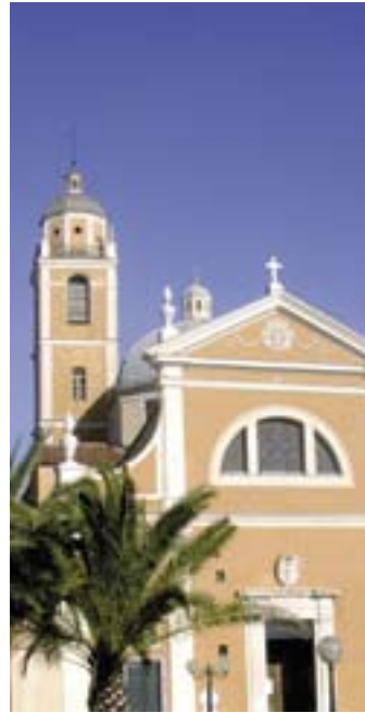
Foto cattedrale, cittadella, città vecchia.

All'origine fu edificata una fortezza al posto dell'attuale cittadella per difendere la colonia genovese che ha creato la città nel 1492. Il piano urbano si densifica, delle mura fortificano la città, poi viene edificata una cattedrale. La famiglia Bonaparte s'installa alla fine del 17° secolo.