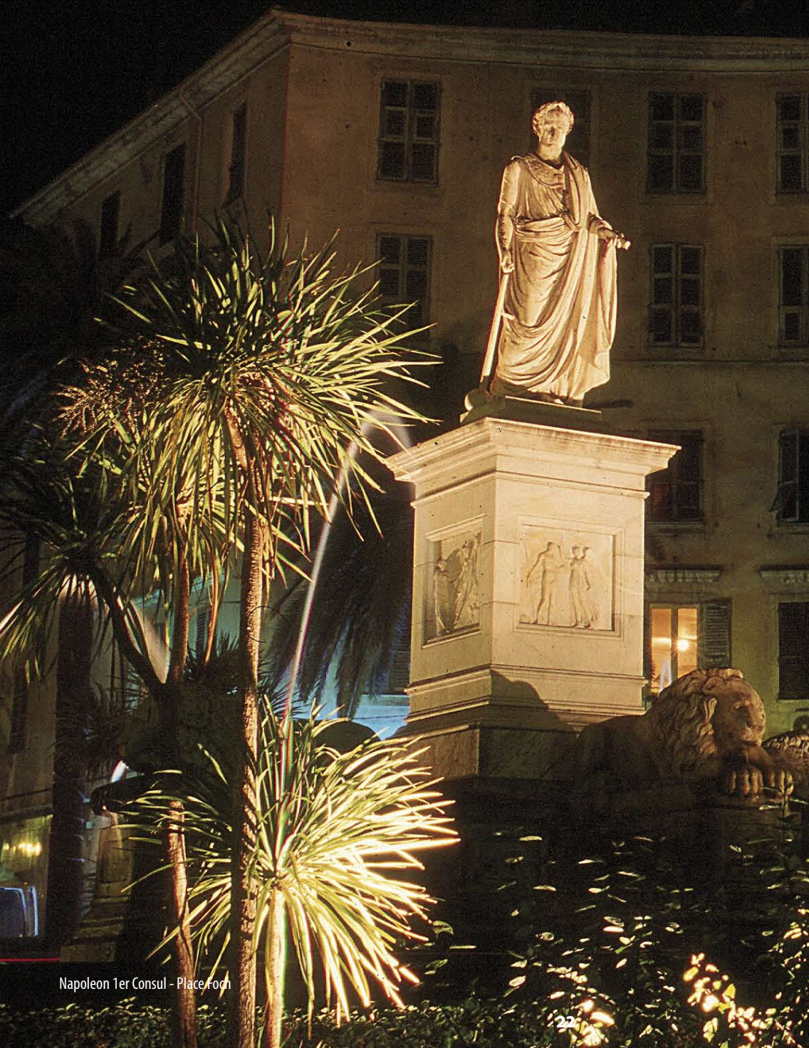
Napoleon 1er Consul - Place Foch

Culture and entertainment - Kultur und unternehmungen - Cultura e uscite